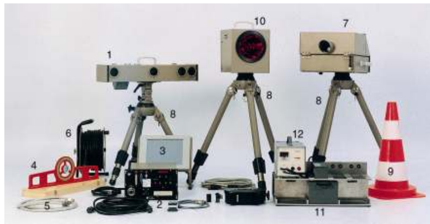
Abb.1:Gerätekomponenten der ES1.0 mit Fotoeinrichtungen FE2.4

Die Verbindung zwischen der Rechereinheit und der/den Foto-