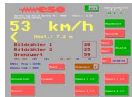
Abb.2:Bildschirm mit Oberflächenmaske "Messbetrieb"

einrichtung(en) erfolgt über jeweils integrierter Datenfunksender-bzw. -empfängereinheit(en). Mit ihnen erfolgt die Auslösung der Fotoeinheiten(en) sowie die Übertragung der Messwerte sowie weiterer Daten zur Kontrolle und Gewährleistung der Datensicherheit.