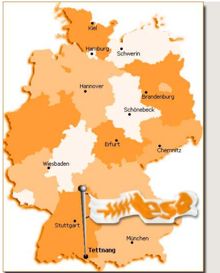
Abb.1: Servicecenter im Überblick

Neben München, Chemnitz, Stuttgart, Schönebeck, Kiel, Schwerin, Hannover, Hamburg, Erfurt und Brandenburg ist Wiesbaden eine weitere wichtige Ergänzung zu o.g. Polizeiwerkstätten und dem Stammwerk Tett nang am Bodensee.